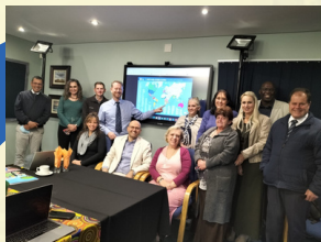
MARIST BROTHERS LINMEYER