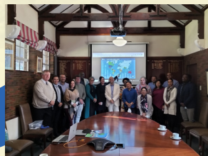
SACRED HEART COLLEGE