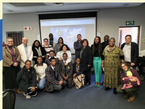
ST DAVID'S MARIST INANDA

Nous avons rappelé aux directeurs, aux professeurs et aux personnes qui s'intéressent aux activités internationales conjointes qu'ils peuvent s'inscrire dans AGORA , dans le groupe d'Internationalisation et se mettre en contact avec ces écoles et les autres écoles Mariste à travers le monde.