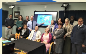
MARIST BROTHERS LINMEYER