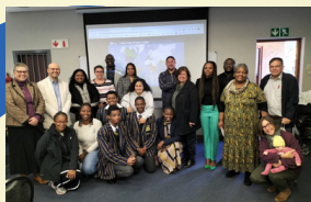
ST DAVID'S MARIST INANDA

Los directores, profesores o quienes tengan interés en fomentar actividades internacionales conjuntas, les recordamos que en AGORÁ , pueden inscribirse en el grupo de Internacionalización y ponerse en contacto con estas y otras escuelas Maristas del mundo: