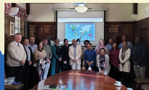
SACRED HEART COLLEGE