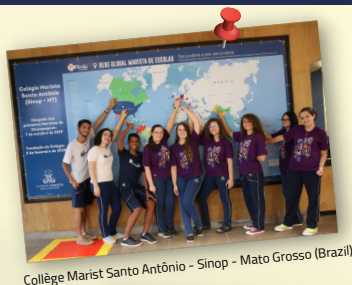
Collège Marist Santo Antônio - Sinop - Mato Grosso (Brazil)